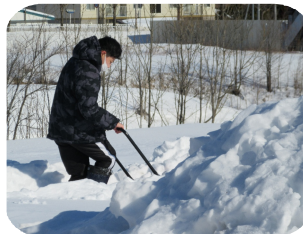
特別養護老人ホームひろね