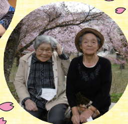
【きりり】 神社山で桜見物！満開の桜たち