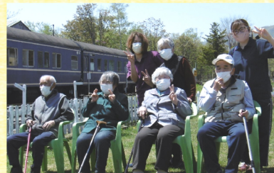
【きりり】 晴れの日ドライブ～ 狩勝高原でピース!