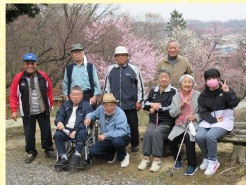
【らら】 神社山の桜見物 相変わらず きれいだねー!!