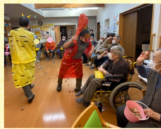
【らら】 鬼は外、 福は内 オー怖い