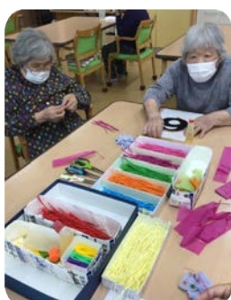
花紙でこより作り 何ができるでしょう