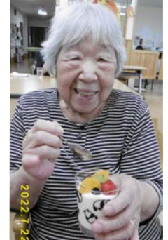
暑い日も甘いもので乗り切ります