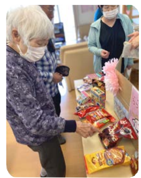
駄菓子屋さん どれにしようかなー！