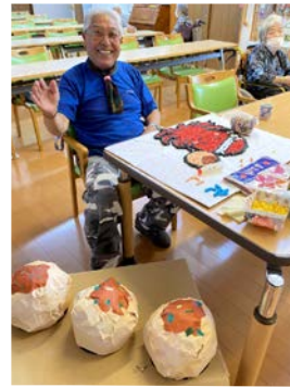
夏祭りの準備中 ♡🐟 みんなも手伝ってくれー！