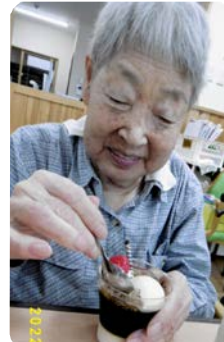
大事な人からの差し入れ 心も満たされます