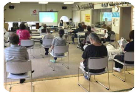
「ゴミの分別とリサイクルについて」みんなで学習しました。