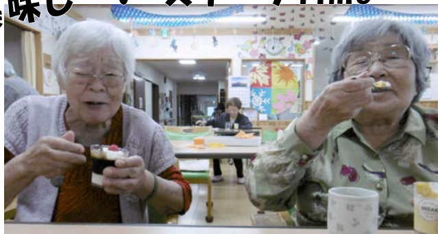
柳月のケーキの時間 ほっぺが落ちます