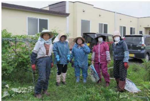
草取りボランティアの皆さま いつもありがとうございます 除草されて花もイキイキ！