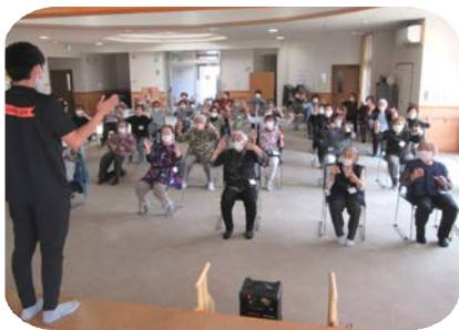
ニサカのインストラクターによる体操とレクリエーションで身体を動かし、新得町の勝利に貢献！