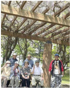
藤棚きれいだったなー！