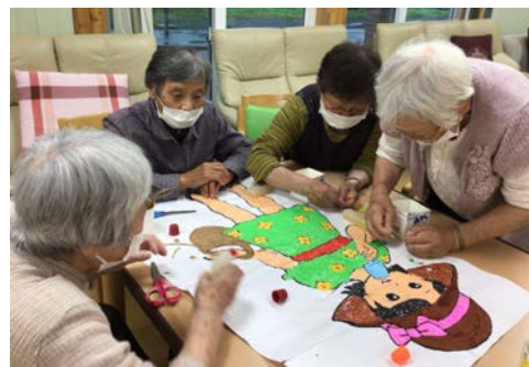
みんなでちぎり絵