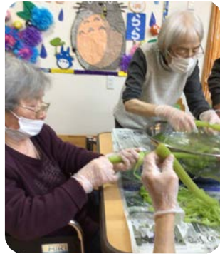
フキの皮むき おいしいフキの料理 たのしみー！