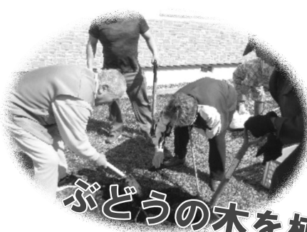
ぶどうの木を植えたよ♪