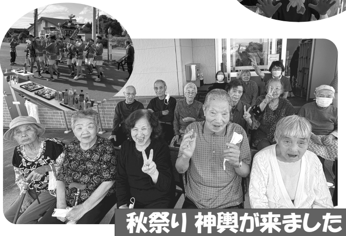
秋祭り 神輿が来ました