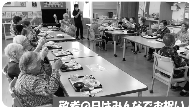
敬老の日はみんなでお祝い！