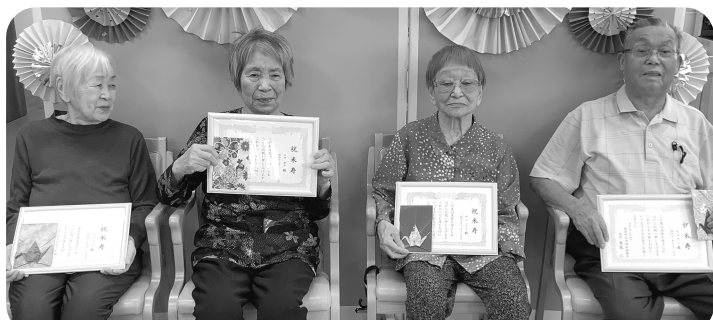
敬老会 4名の方が米寿でお祝いされました