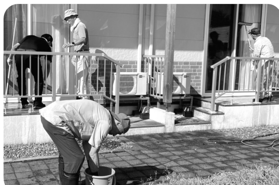
役場OB会の皆さん 窓ガラス清掃ありがとうございます！