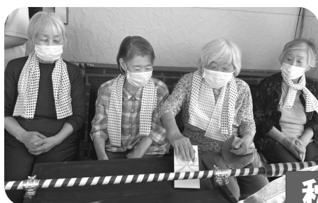
秋祭り参加しました