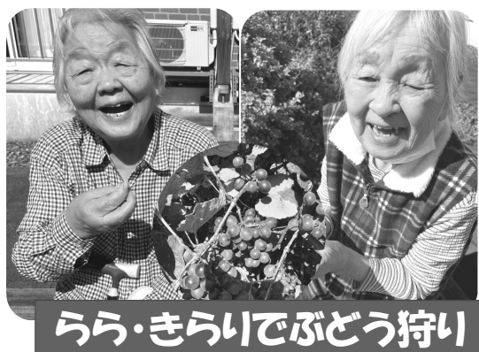
らら・きらいでぶどう狩り