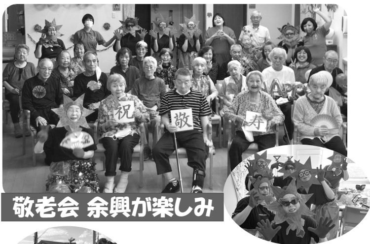
敬老会 余興が楽しみ