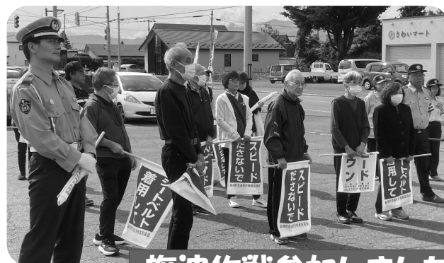
旗波作戦参加しました