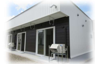
南側から見た外観